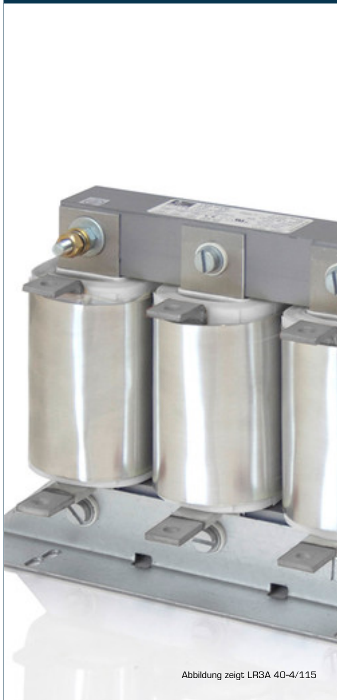
Abbildung zeigt LR3A 40-4/115